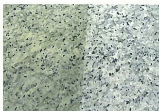
御影石水磨き 経年に渡る黄ばんだワックスの剥離