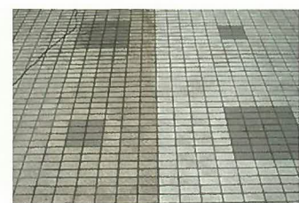
磁器タイル 外床の洗浄

「アルクリーナー」は優れた洗浄力を発揮し 酸性洗剤のように石材を白く荒らすようなことはありません。