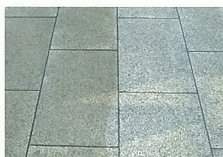
御影石水磨き仕上げ 外床の洗浄